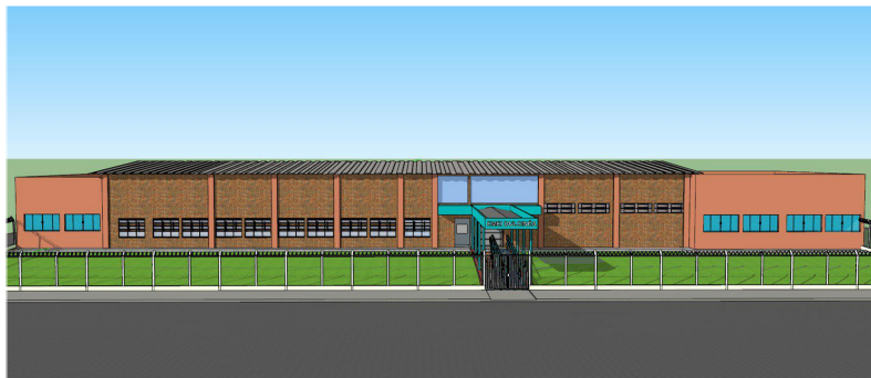
VISTA 01 - FACHADA SEM ESCALA