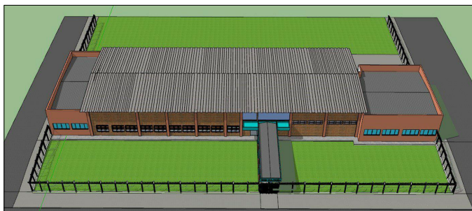
VISTA 04 - FACHADA/COBERTURA SEM ESCALA