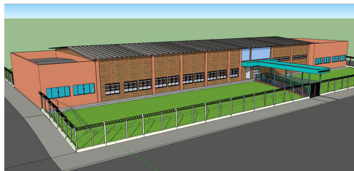
VISTA 02 - FACHADA SEM ESCALA