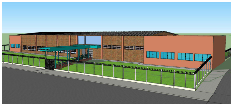
VISTA 03 - FACHADA SEM ESCALA